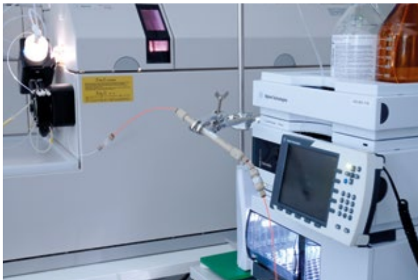
Kopplung der LC mit der ICP-MS zur Element-Spezies-Bestimmung

Sowohl die essentiellen als auch die toxischen Eigenschaften der Elemente hängen meistens von ihrer chemischen Bindungsform ab bzw. in welcher Spezies diese Elemente vorliegen. So haben z.B. sechswertige Chromverbindungen eine deutlich höhere Toxizität als die dreiwertigen Chrom-Spezies. Im Falle des Arsens sind die anorganischen Spezies eindeutig kanzerogen und stark toxisch verglichen mit dem viel weniger toxischen Arsenobetain. Gerade diese organisch gebundene Spezies kann jedoch nach Fischverzehr den Gesamt-Arsen-Gehalt im Urin signifikant erhöhen somit eine Intoxikation mit Arsen vortäuschen. In so einem Fall ist zur klinischen Diagnostik daher die quantitative Differenzierung der einzelnen Arsen-Spezies im Urin notwendig.